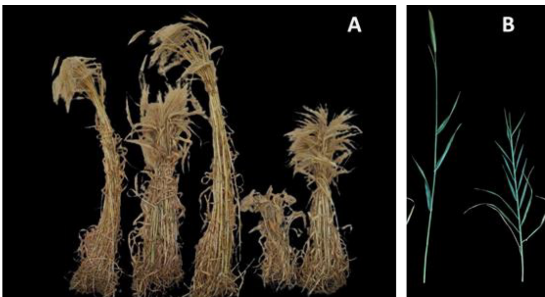
Фигура 4. Мутанти с промени във височината на стъблото (А) и тип many-noded dwarf (В) (вляво - изходният сорт)

Анализът на добива и стабилността на добива по години за период от осем реколтни години е проучен при 12 мутантни линии. Пет от тях се отличиха със значително по-ви-