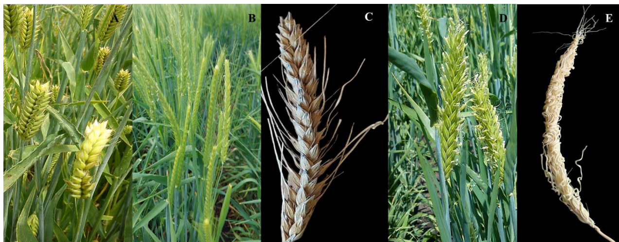
Фигура 3. Мутанти с изменения в осилите: безосилести (А); с скъсени осили (В); с редуцирани осили на централните класчета и безосилести странични (С); от типа hooded (D) и curly (E)

Отбрани са голозърнести форми ( naked caryopsis 1 - nud1 ) както от български сортове Веслец и Имеон, така и от чуждестранни сортове като Endeavor и Monika. Особено ценни са мутантите, получени от наши сортове, които са добре адаптирани към местните агроклиматични условия и се отличават с висока зи-