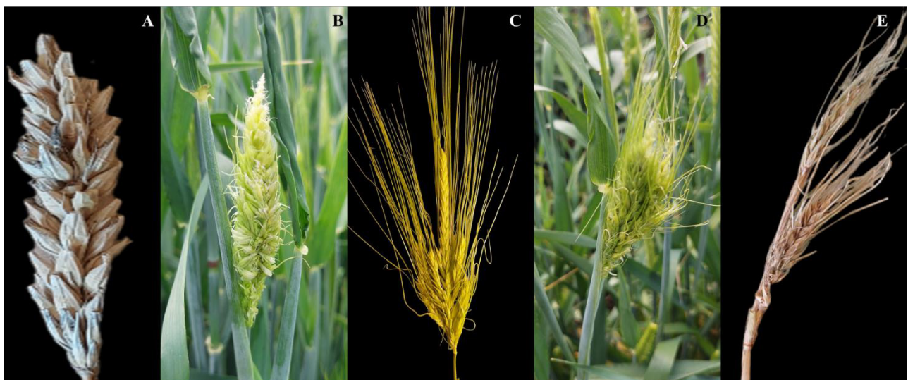
Фигура 1. Морфология на класовете при предполагаеми мутанти: multiflorus2.b (А), rattail -подобен с частична фертилност (В), compositum2 (С), vrs4 (D) и multiple stem nodes and spikes and dwarf-msnsd (E)

Открити са няколко мутанта, които се отличават от характерното за ечемика детерминантно развитие на класчетата и формират повече от едно цветче във всяко класче. При мутант, получен от сорта Вауава, вретенцата на някои страничните класчета са удължени и образуват до три цветчета в класче, докато централните класчета запазват детерминантния си характер и съдържат само едно цветче. Това предполага различен генетичен контрол върху развитието на централните и страничните класчета (Фигура 1А). Предполагаме, че този мутант е аналогичен на multiflorus2.b ( mul2.b ), описан от Korpolu et al. (2022). При генетичния анализ на mul2.b са идентифицирани един основен QTL на хромозома 6Н и вторичен QTL на 5Н, контролиращи образуването на допълнителни цветчета в централните класчета, както и два основни QTL на хромозоми 2Н и 6Н и два вторични на 3Н,