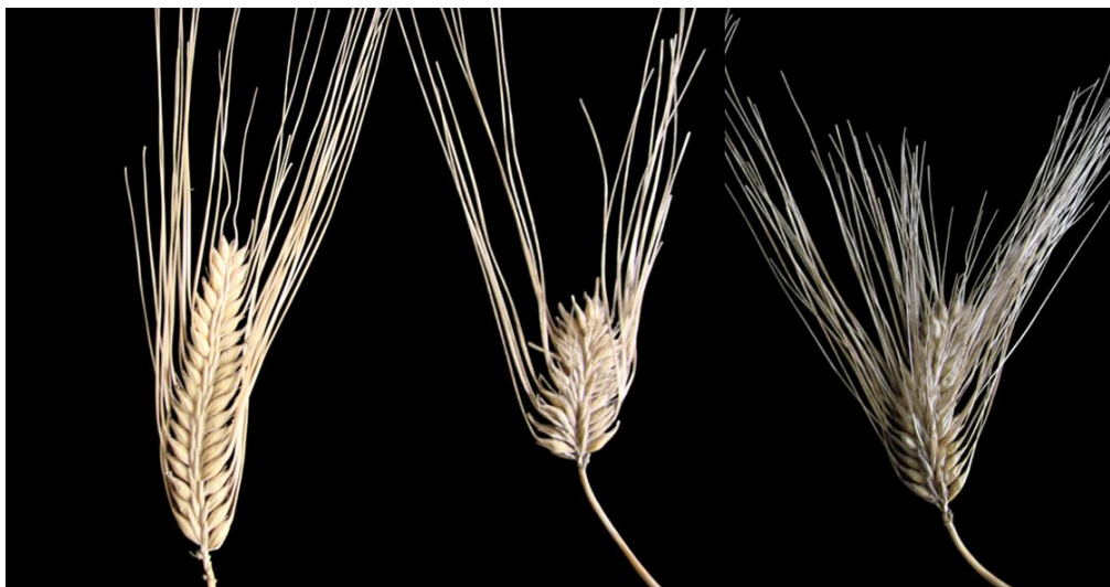
Фигура 2. Мутанти с повишена плътност на класа (най-вляво – изходният сорт Емон) Figure 2. Spike density mutants (the original cultivar Emon is shown on the far left)

Отбрани са няколко безосилести мутанти от различни родителски сортове, с фенотип съответстващ на мутантен тип awnless 1 - Lks1 (Franckowiak, 1997a) (Фигура 3A). Макар ечемикът традиционно да се използва за фураж и малц, безосилестите форми са особено ценни при използване на културата за паша, силаж или сено, тъй като грубите осили могат да причинят наранявания в устната кухина и по муцуните на животните. Внесените безосилести форми често са слабо адаптирани към местните условия, което подчертава значимостта на индуцираните мутанти, получени на основата на наши сортове с висока зимоустойчивост. Много от изследваните безосилести мутанти проявяват повишена чувствителност към болести и склонност към полягане. Въпреки това, няколко от линиите демонстрират обещаващ потенциал по отношение на добива от биомаса и зърно.